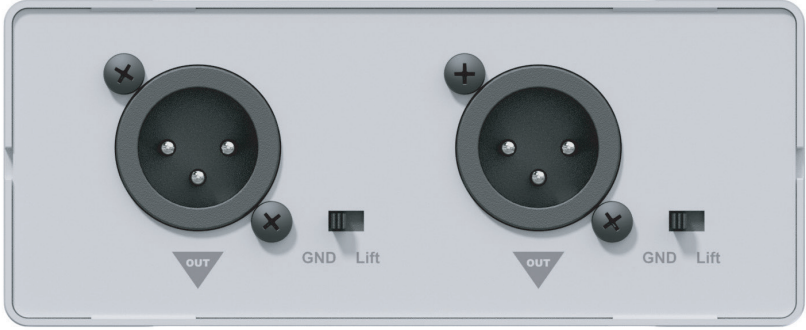
ALI20MK2'nin arka paneli