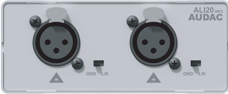
ALI20MK2'nin ön paneli